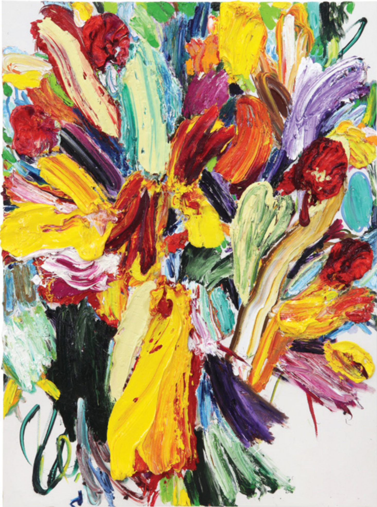
Lay Out (282), oil on canvas, 175 x 130 x 7 cm, 2016/20