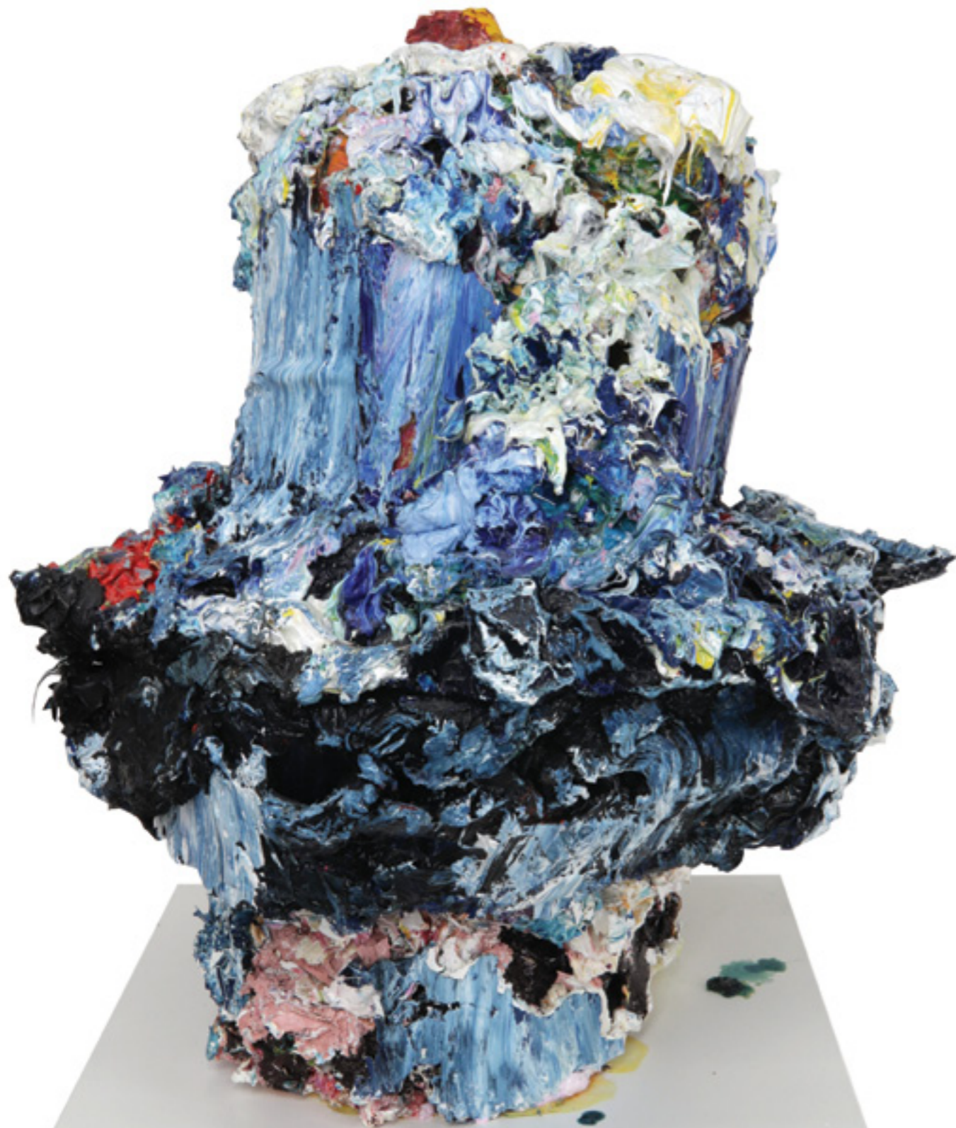
Take Out (20), oil on wooden base, 40 x 36 x 37cm, 2020