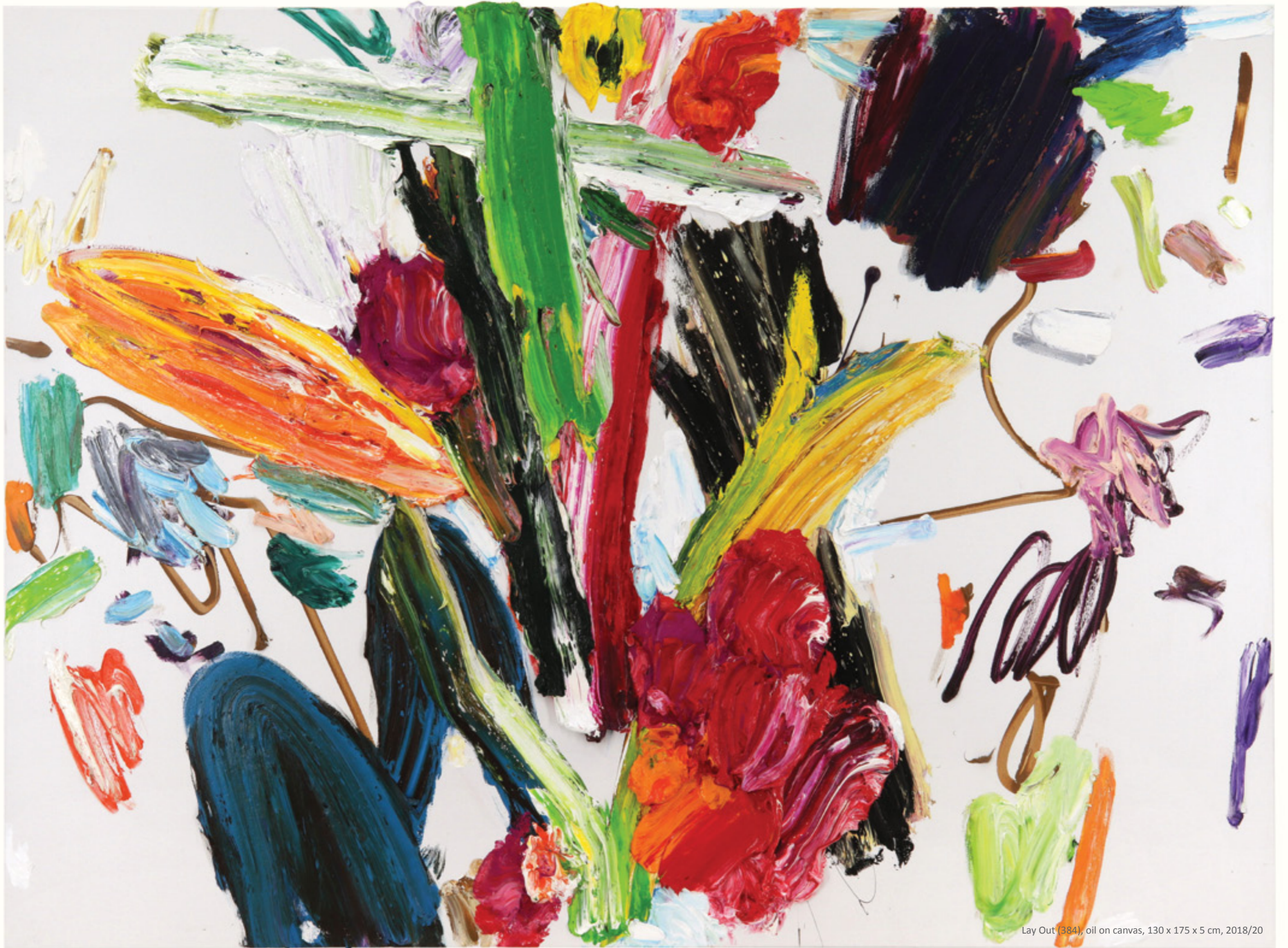
Lay Out (384), oil on canvas, 130 x 175 x 5 cm, 2018/20