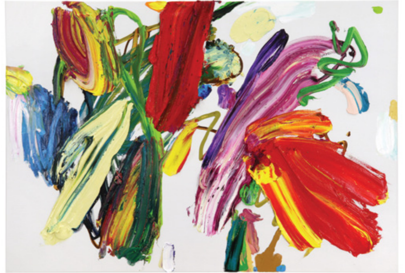
Dedication (37), oil on canvas, 90 x 130 x 5 cm, 2021