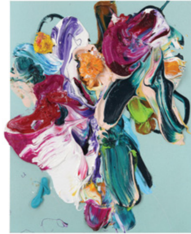
Lay Out (459), oil on canvas panel, 30 x 25 x 2 cm, 2019