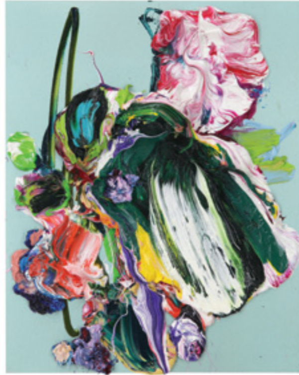
Lay Out (460), oil on canvas panel, 30 x 24 x 4 cm, 2019