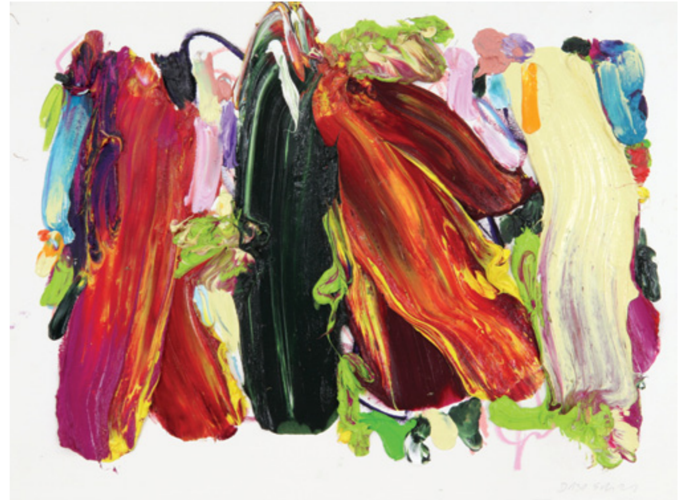
Draw Up (130), oil and oil pastel on paper 57 x 76 x 2 cm, 2021