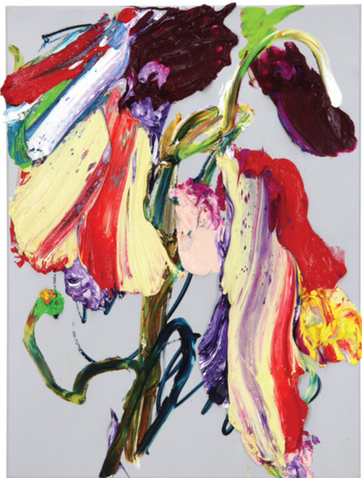
Dedication (20), oil on canvas, 80 x 60 x 4 cm, 2020