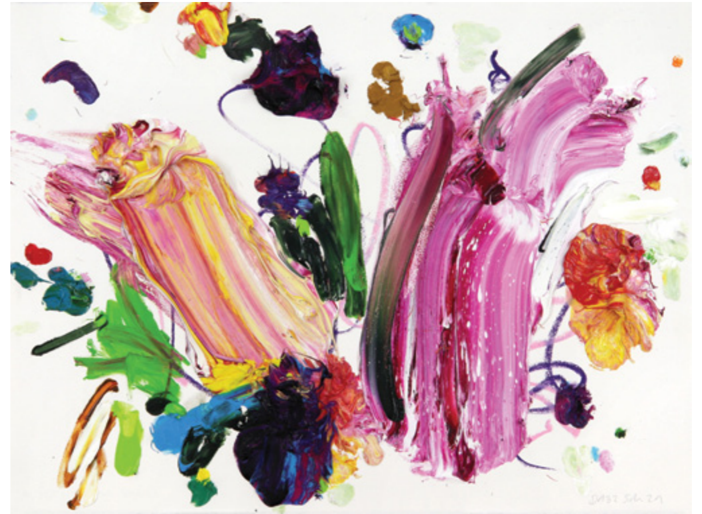
Draw Up (132), oil and oil pastel on paper, 57 x 76 x 3 cm, 2021