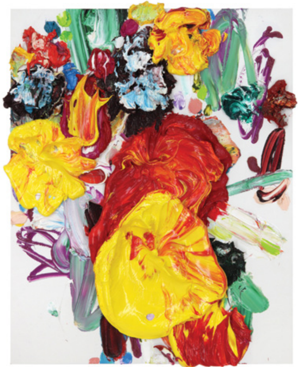
Lay Out (316), oil on canvas panel, 52 x 42 x 3 cm, 2017/20