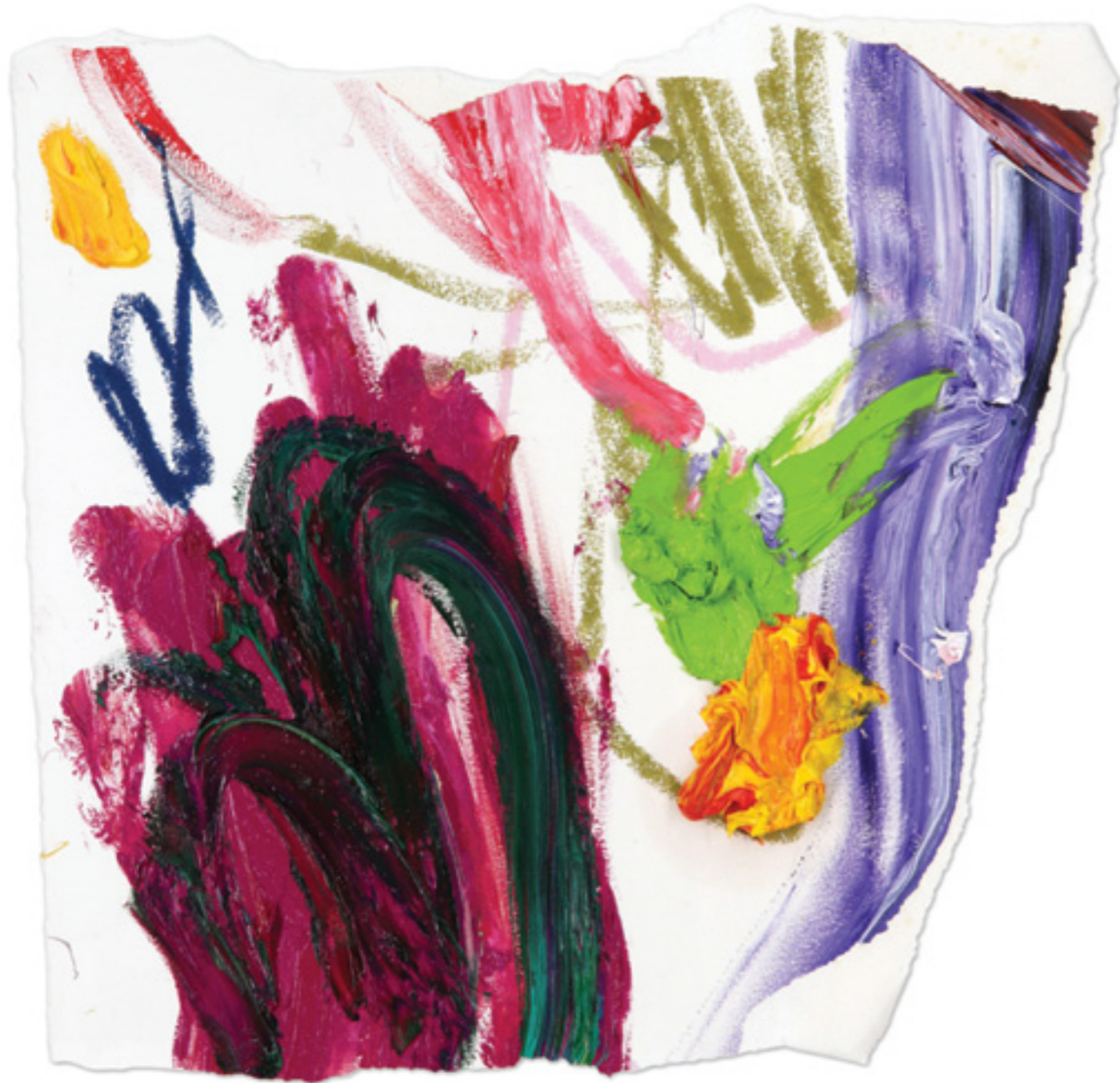
Tear Up (03), oil and oil pastel on paper, 34 x 35 cm, 2019