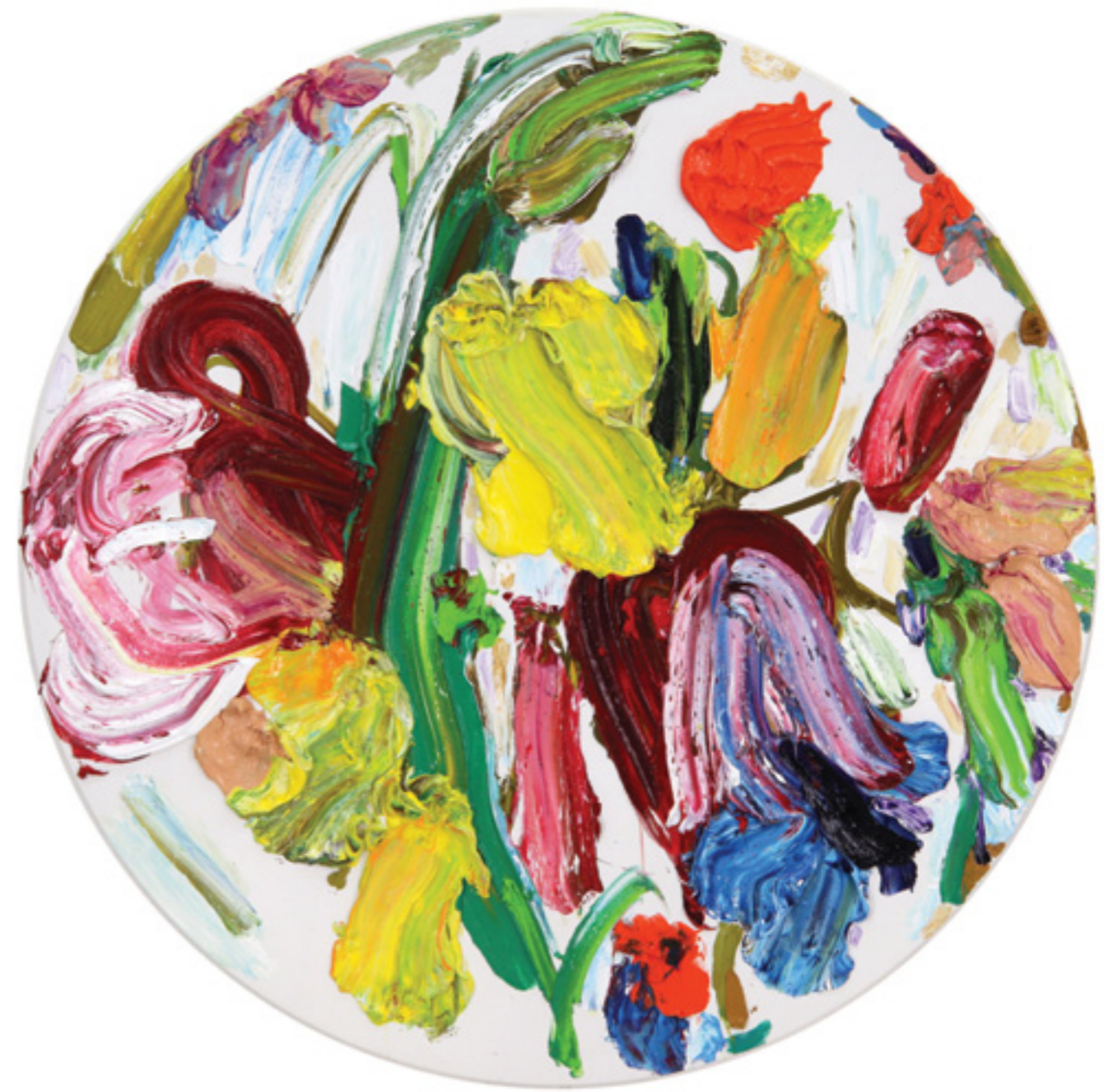
Dedication (41), oil on canvas, Ø 150 x 5 cm, 2021