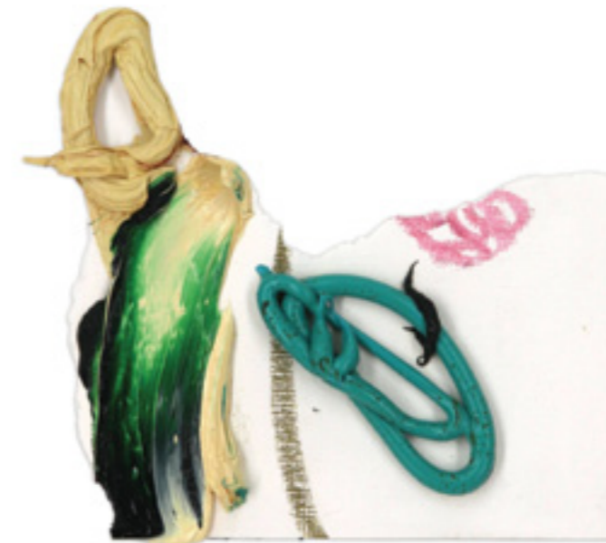
Tear Up (20), oil and oil pastel on paper, 12 x 13 cm, 2020