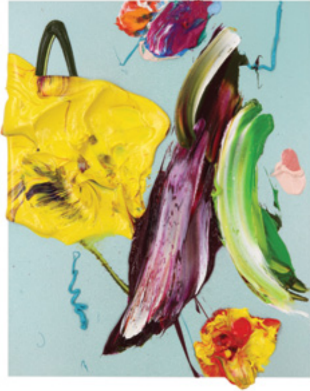
Lay Out (489), oil on canvas panel, 31 x 25 x 2 cm, 2020