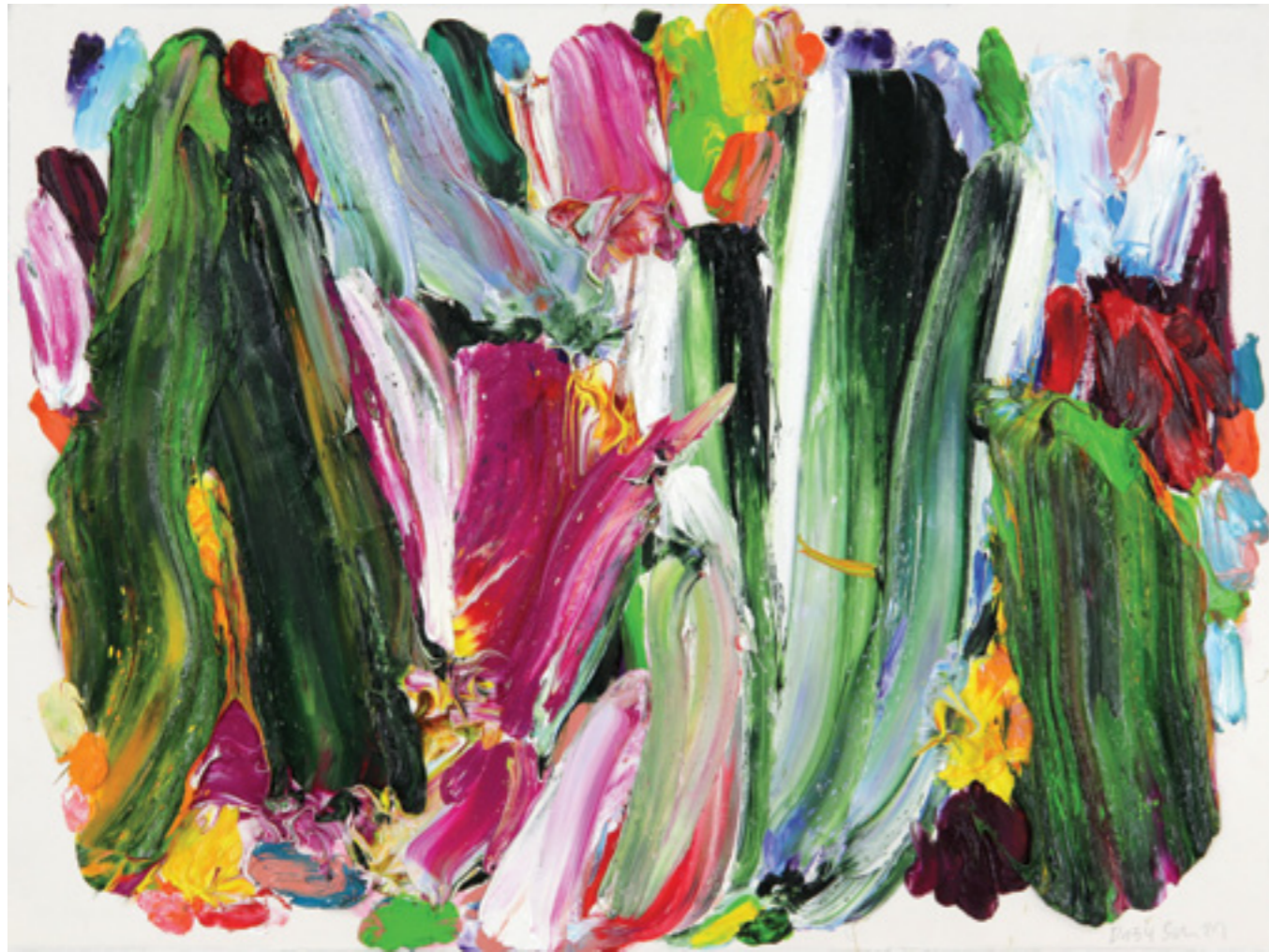
Draw Up (134), oil and oil pastel on paper, 57 x 76 x 2 cm, 2021