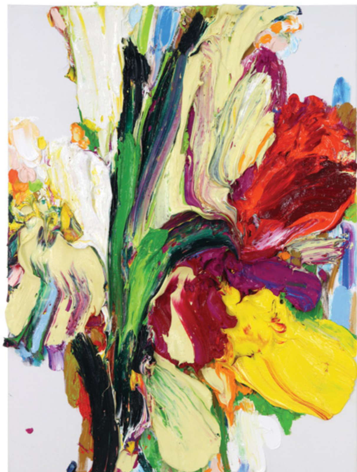
Lay Out (505), oil on canvas, 81 x 61 x 6 cm, 2020