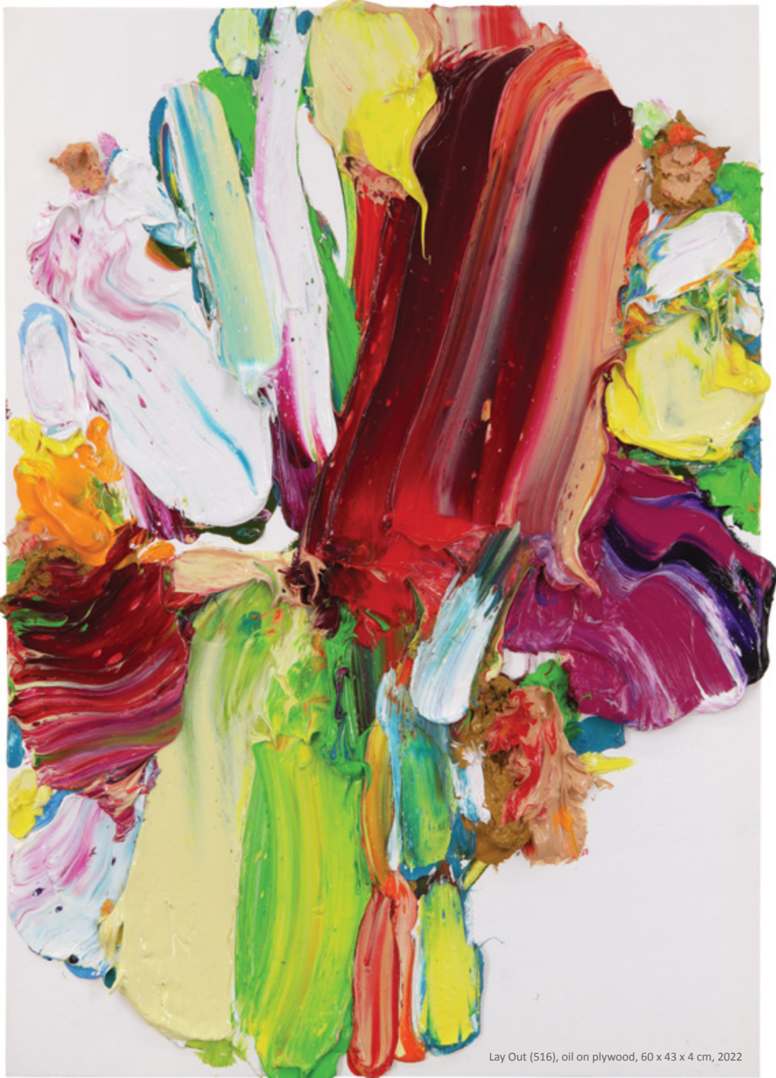
Lay Out (516), oil on plywood, 60 x 43 x 4 cm, 2022