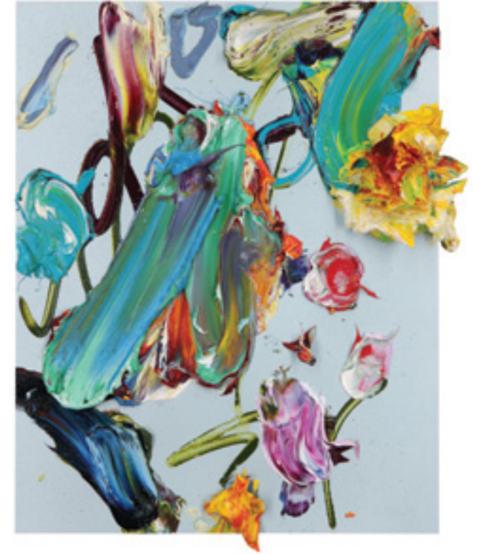
Lay Out (404), oil on canvas panel, 31 x 26 x 3 cm, 2019