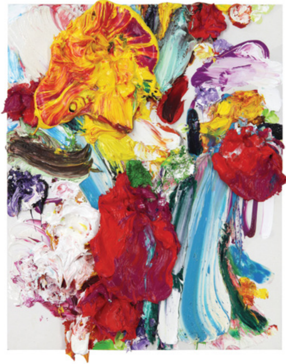
Lay Out (293), oil on canvas panel, 53 x 41 x 3 cm, 2016/20