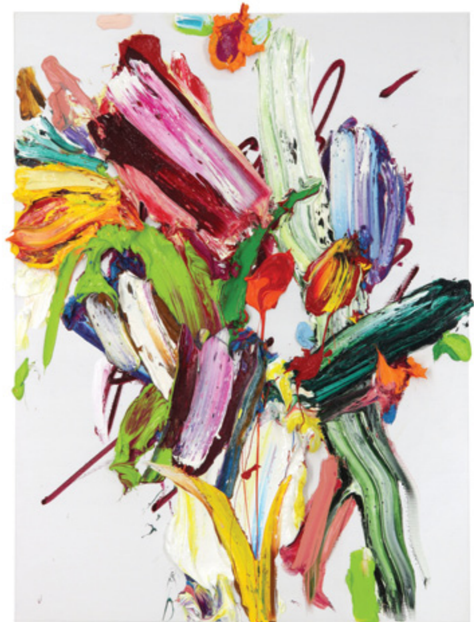
Dedication (08), oil on canvas, 80 x 60 x 6 cm, 2019