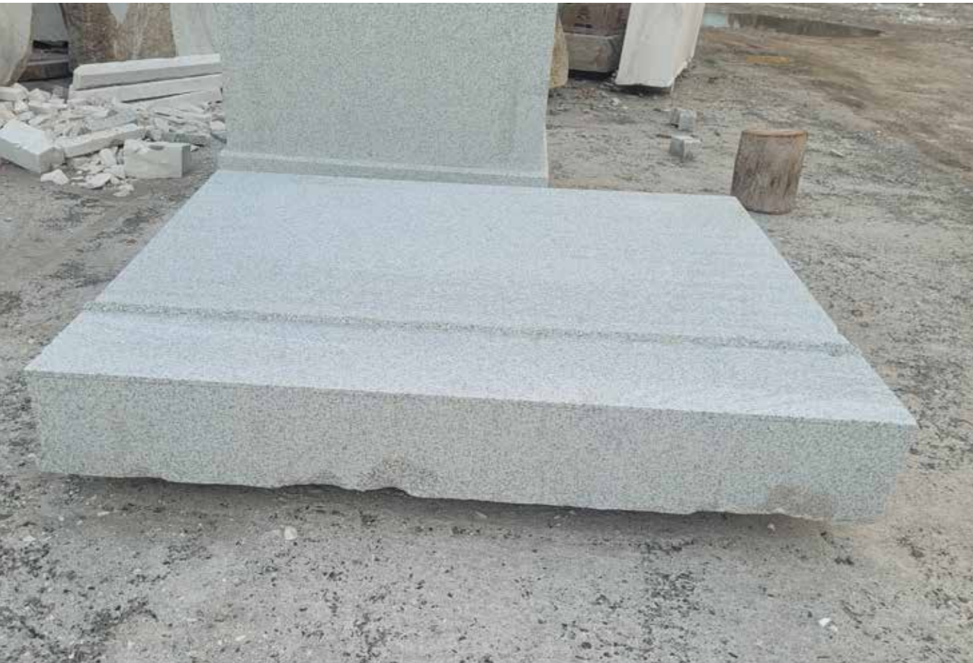
Der Granit Rohblock nach dem Zuschnitt im Natursteinwerk von Tufshin Jargal, Ulaanbaatar.