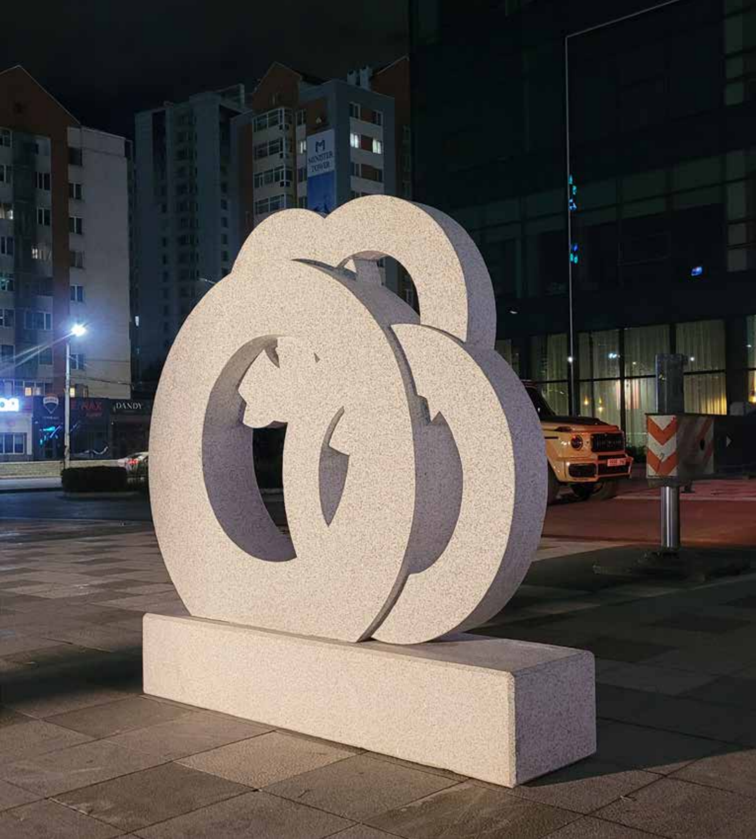
Vor der Eröffnung. Before the opening.