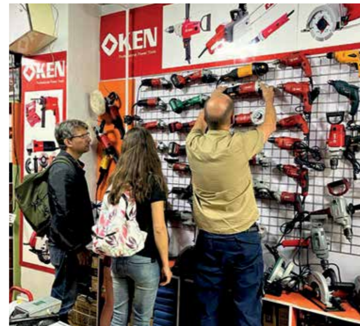
Bildhauer lieben es Werkzeug zu kaufen. Sculptors love shopping for tools.