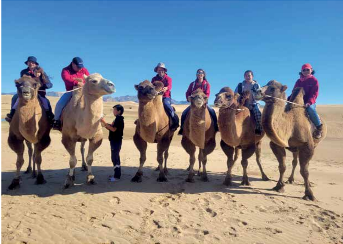
Es war eine herrliche Erfahrung nach unserem Symposium für 4 Tage eine Tour in der Mongolei zu erleben. It was a extraordinary sensation to have the opportunity for a 4 days trip in Mongolia after the symposium.