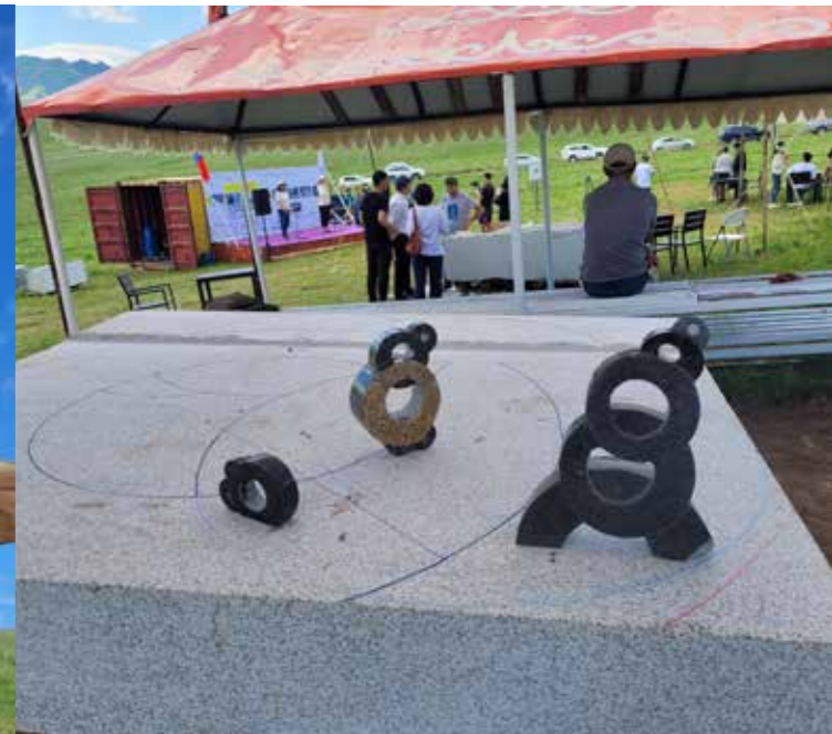
Das Einrichten am Arbeitsplatz, Guru Eco Lodge, Terelj National Park, Setup at the worksite in Guru Eco Lodge, Terelj national park