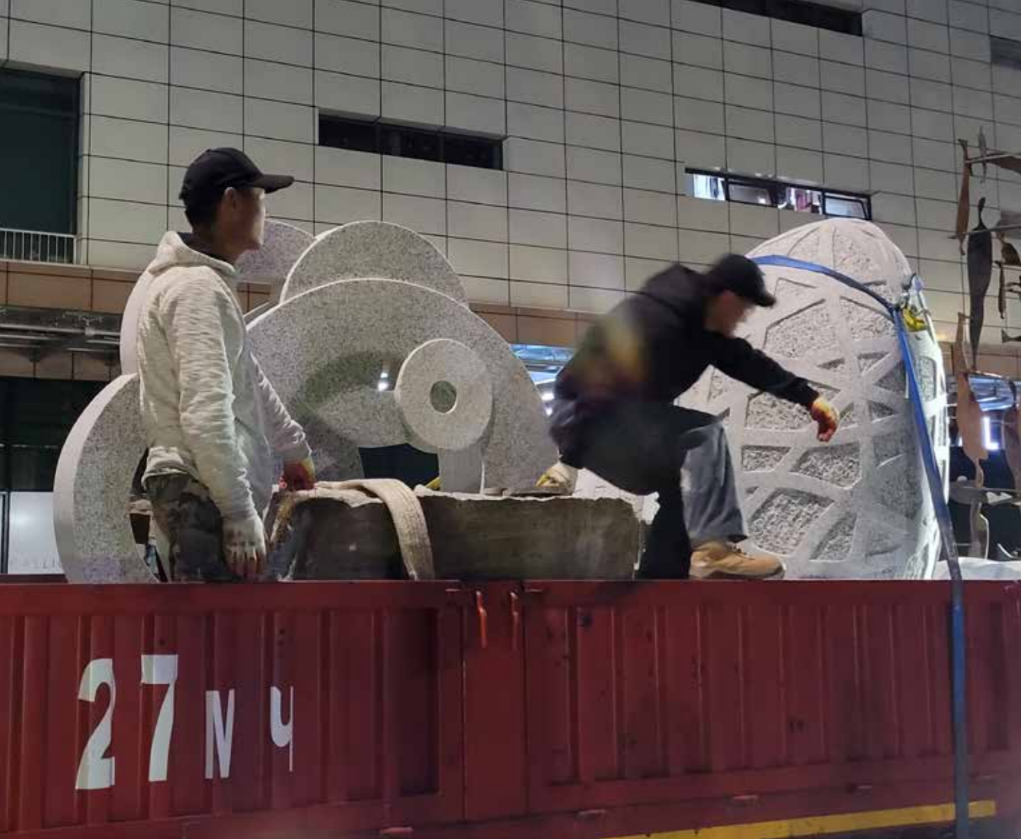
Aufbau der Ausstellung nachts an der der Khaan Bank. Installation of the exhibition at night at the Khaan Bank.