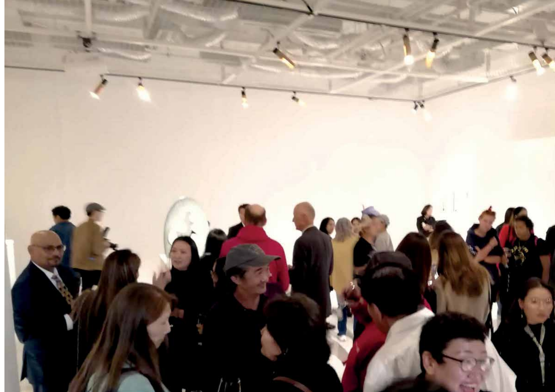
Khaan Bank gallery Ulaanbaatar Vernissage at the 24th of August 2023.