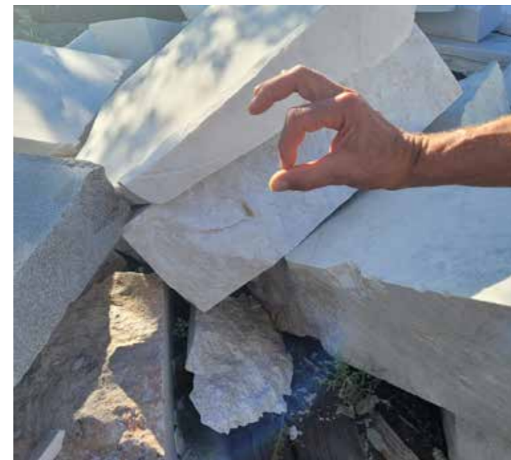
Ein paar Marmorstücke. A few peaces of marble.