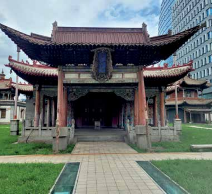
Tempel Museum in Ulaanbaatar. Temple Museum in Ulaanbaatar.