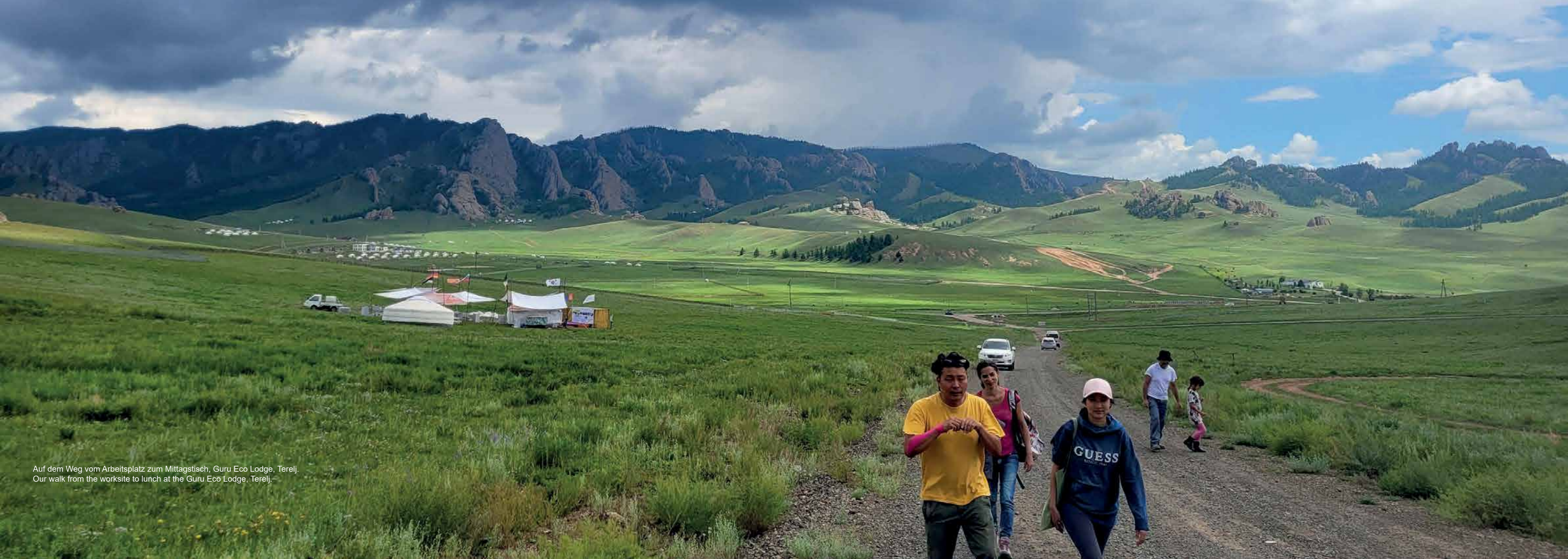
Auf dem Weg vom Arbeitsplatz zum Mittagstisch, Guru Eco Lodge, Terelj. Our walk from the worksite to lunch at the Guru Eco Lodge, Terelj.