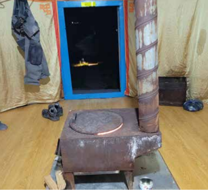
Nachts in der Jurte. At night inside the Ger.