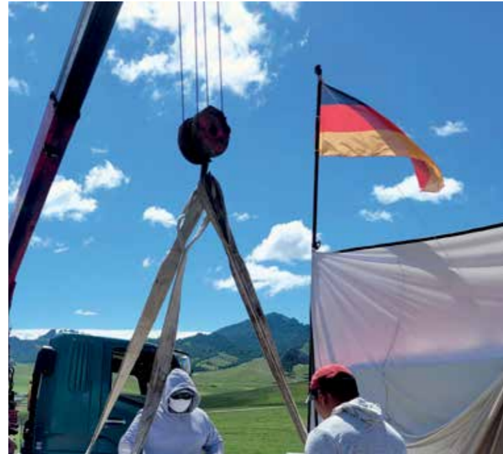
Großes Können und tiefe Inspiration. Great skill and deep inspiration.