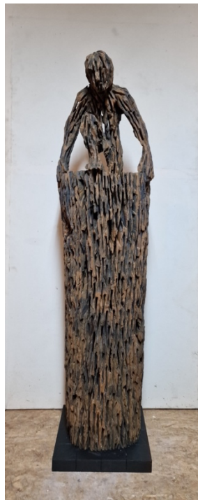
WVZ-Nr. 185, Holz, patiniert, 170 x 40 x 40 cm