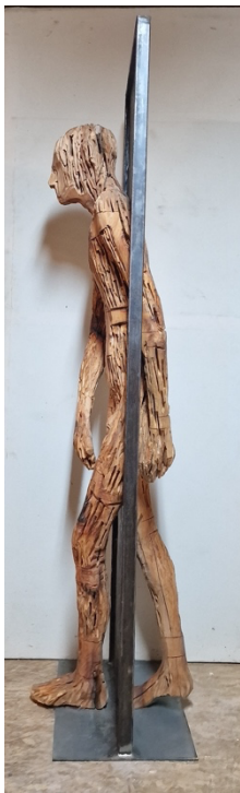
WVZ-Nr. 180, Holz, Eisen, 205 x 58 x 32 cm

ZELJKO RUSIC (*1967, Croatia) focuses on the human being in his works. Emotions, feelings, complex thought processes are the central subject of the works: It is about confrontations - for him as an artist during the creative process, for the viewer every time he looks at one of his sculptures. Abstract and figurative - two seemingly opposing artistic positions unite in each object. It is precisely this distinctive stylistic device that makes ZELJKO RUSICS works permanently interesting.