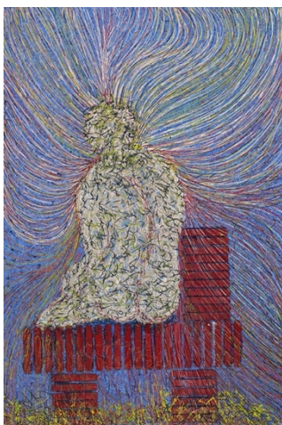
Femme assise main pas à genoux, Öl, Acryl String-Gel, Holz, 150 x 110 cm