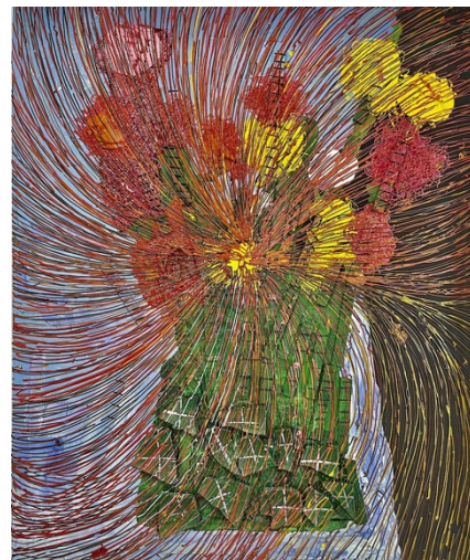
Bouquet de fleurs, Mischtechnik auf Leinwand, 120 x 100 cm