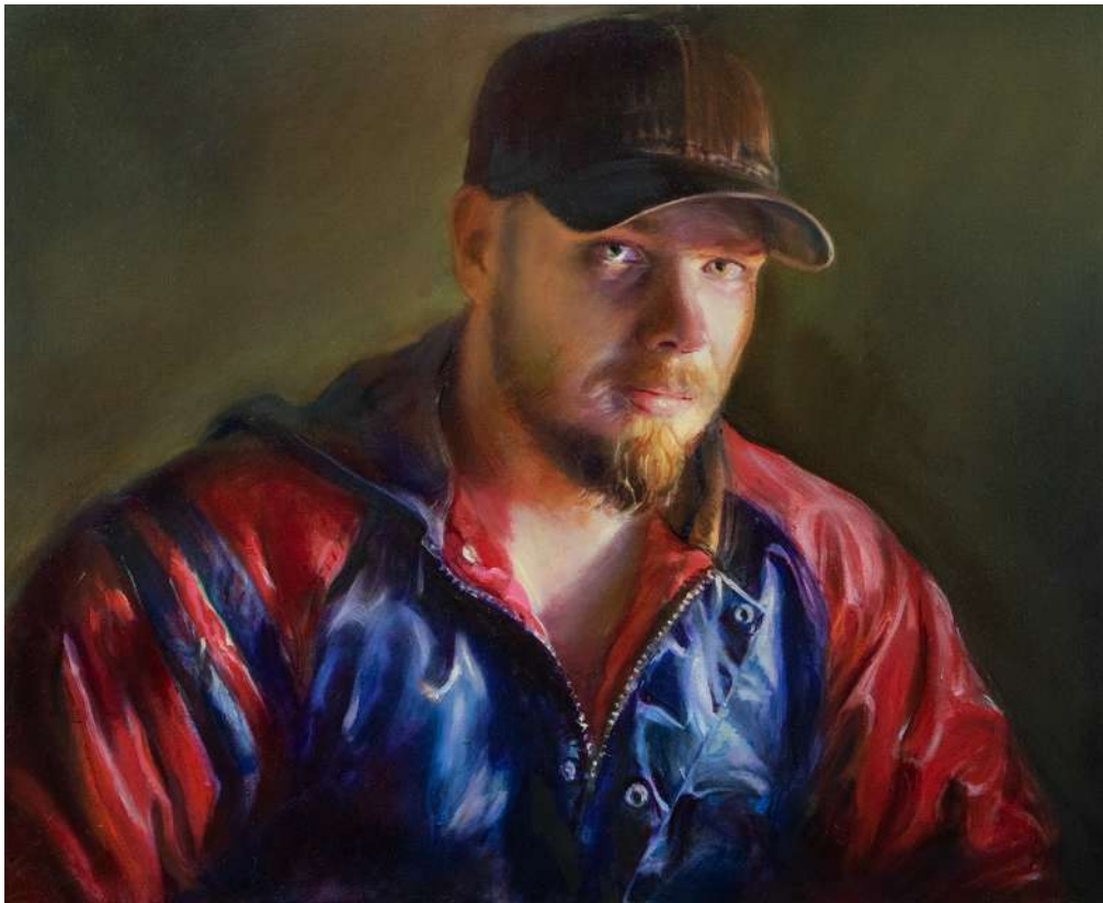
Junger Mann mit Bart, 2023, Öl auf Tafel, 40 x 50 cm