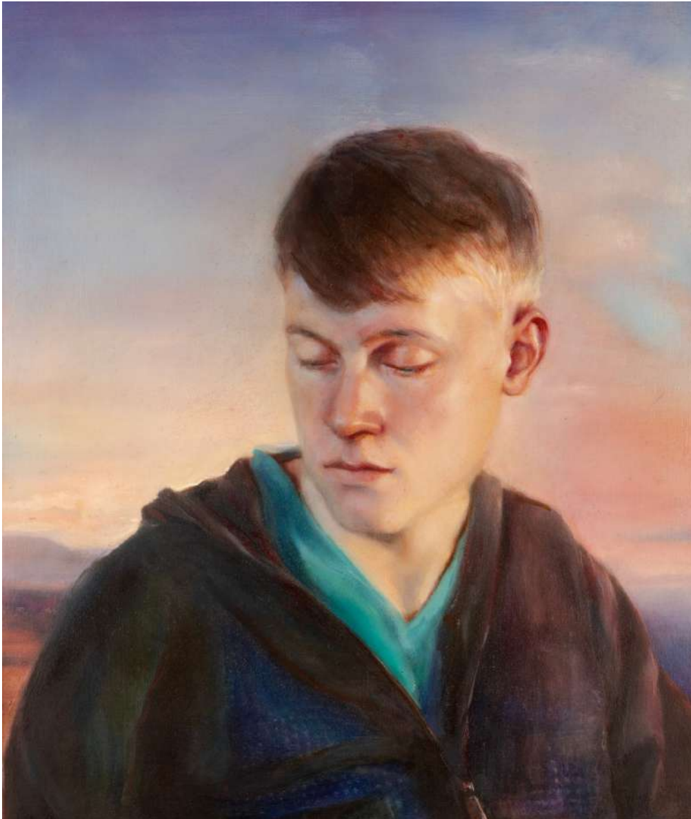
Junge im Abendlicht, 2024, Öl auf Tafel, 65 x 55 cm