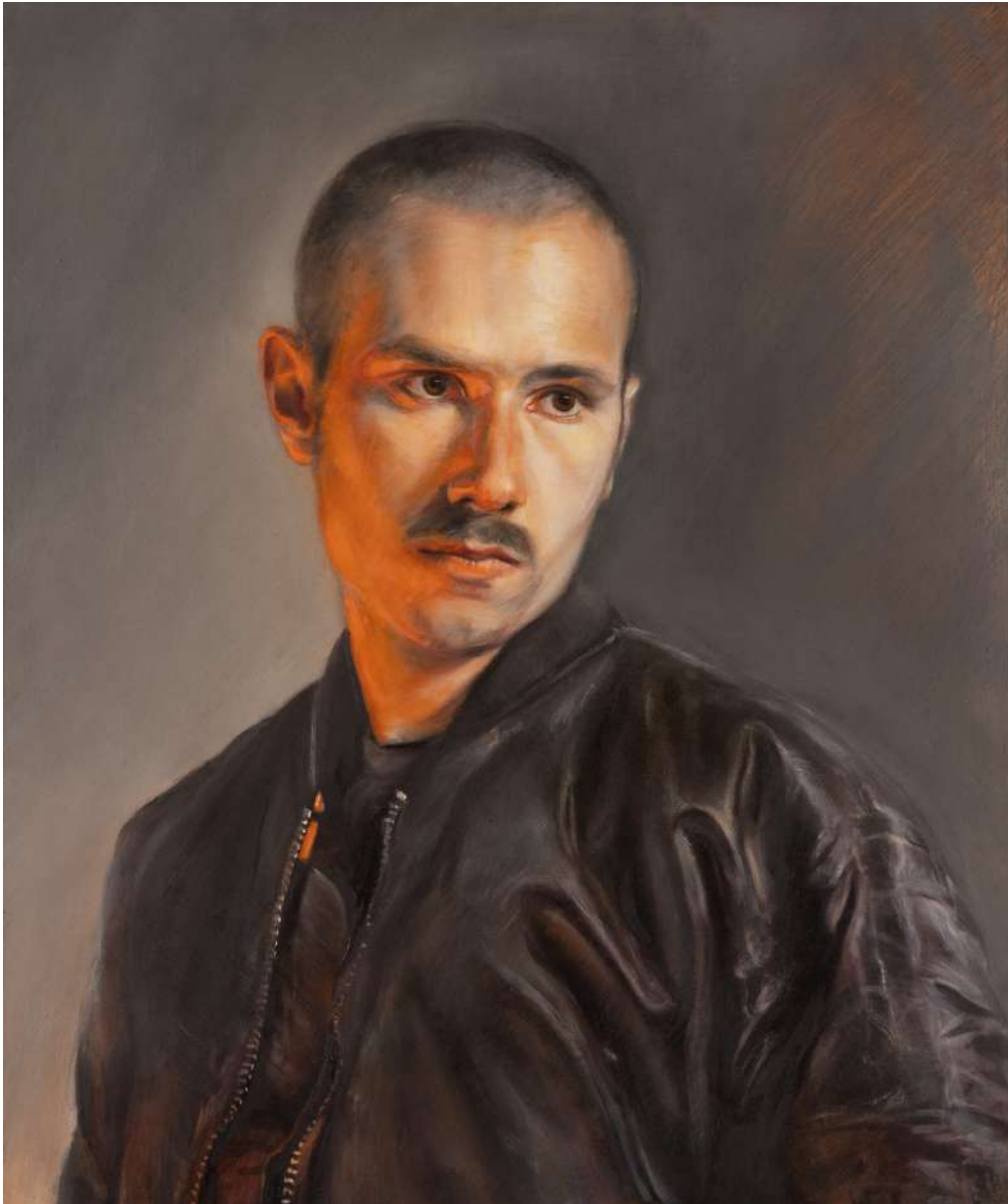
Emil mit Schnauzbart, 2023, Öl auf Tafel, 65 x 54 cm