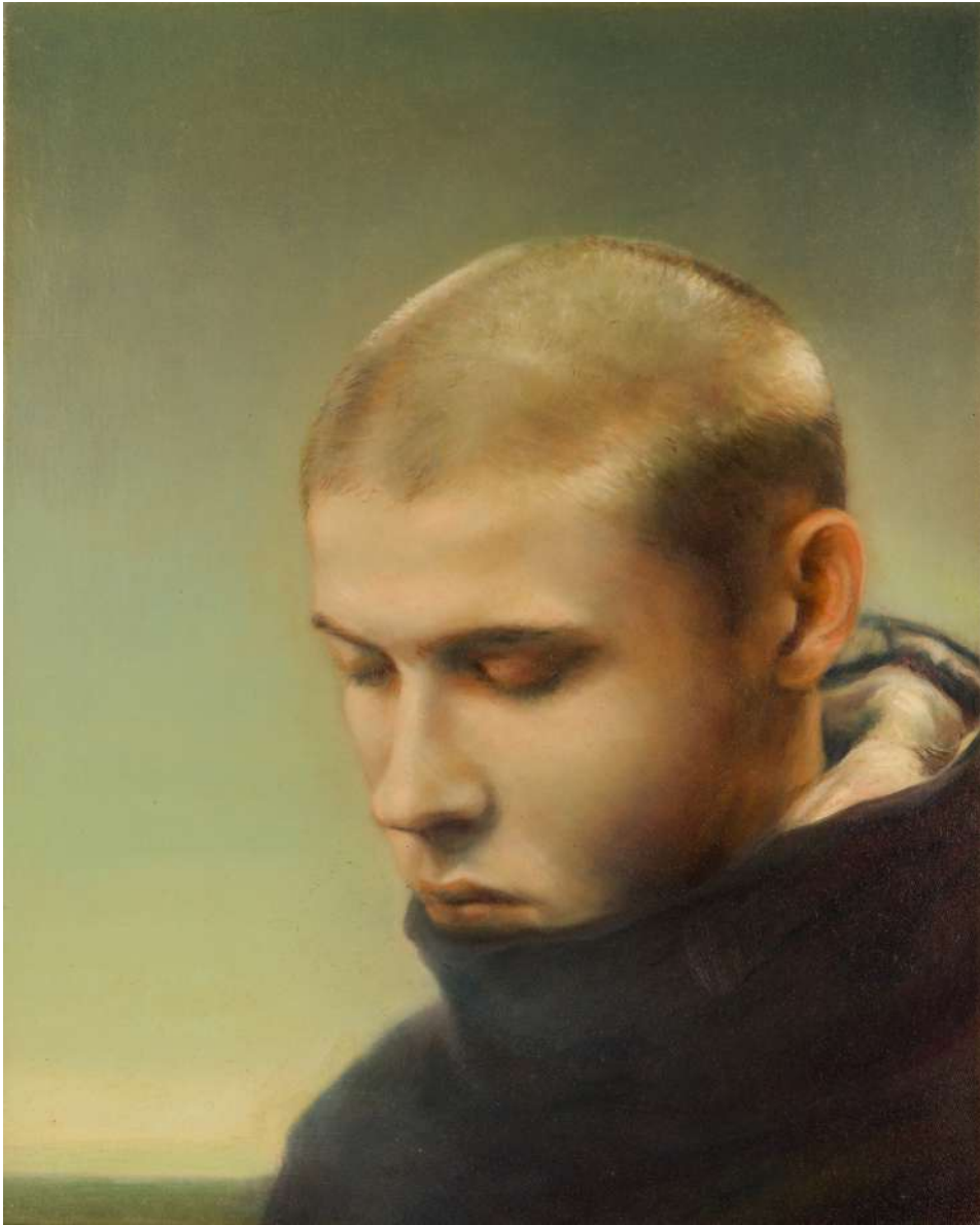
Ein wenig Ruhe, 2024, Öl auf Leinwand, 50 x 40 cm