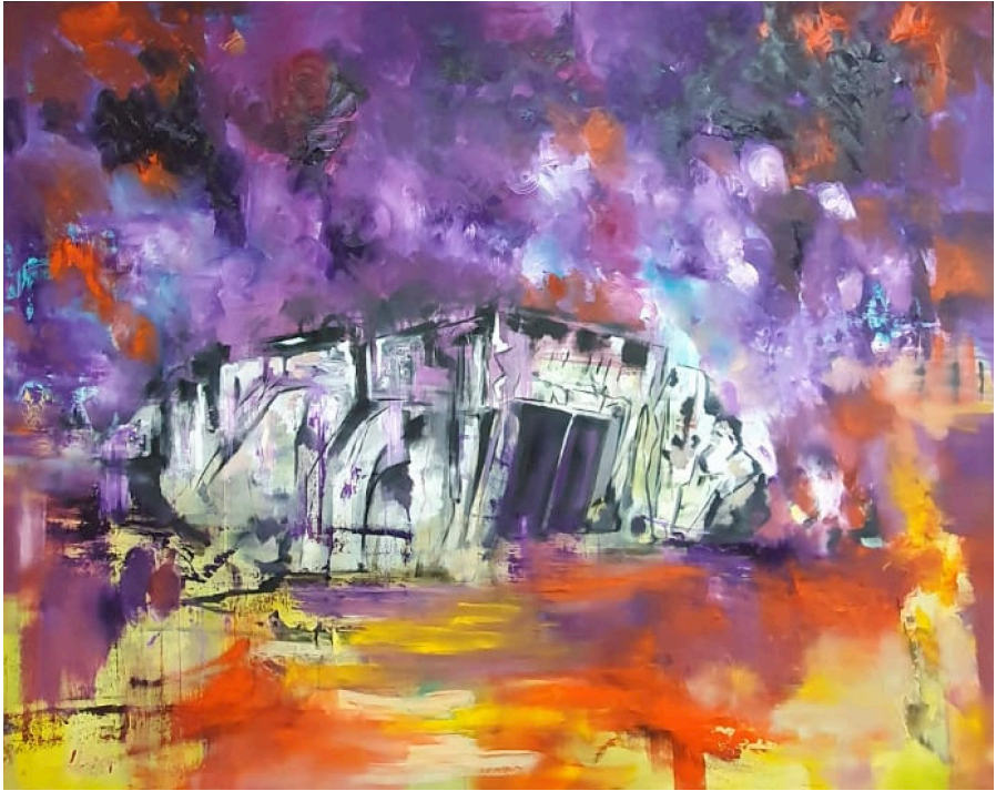
URLAUB AM ATLANTIK-WALL, 2025, Öl auf Leinwand, 200 x 250 cm