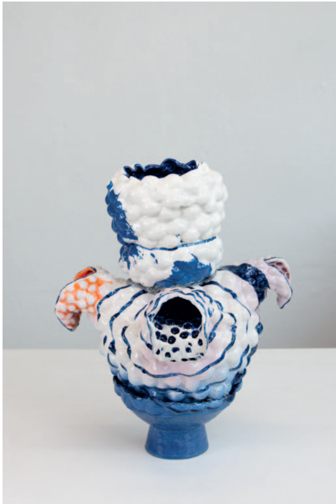
O.T. Keramik / Glasur 45 x 35 x 35 cm / 2024