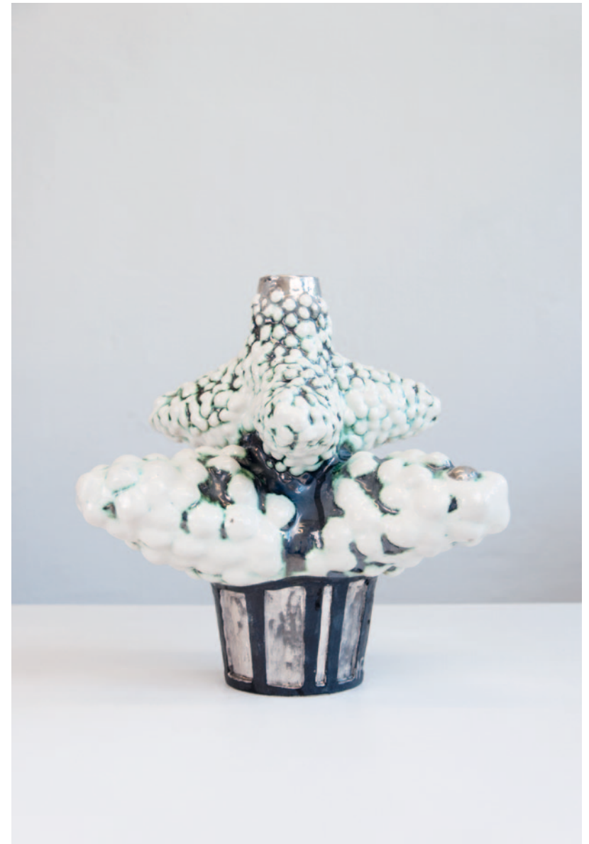
Keramikobjekt für das Süddeutsche Zeitung Magazin (Ausgabe 45/2023)

Tanne mit Schnee Keramik / Glasur / Platin / Kerzen / Blumen 50 x 50 x 50 cm / 2023