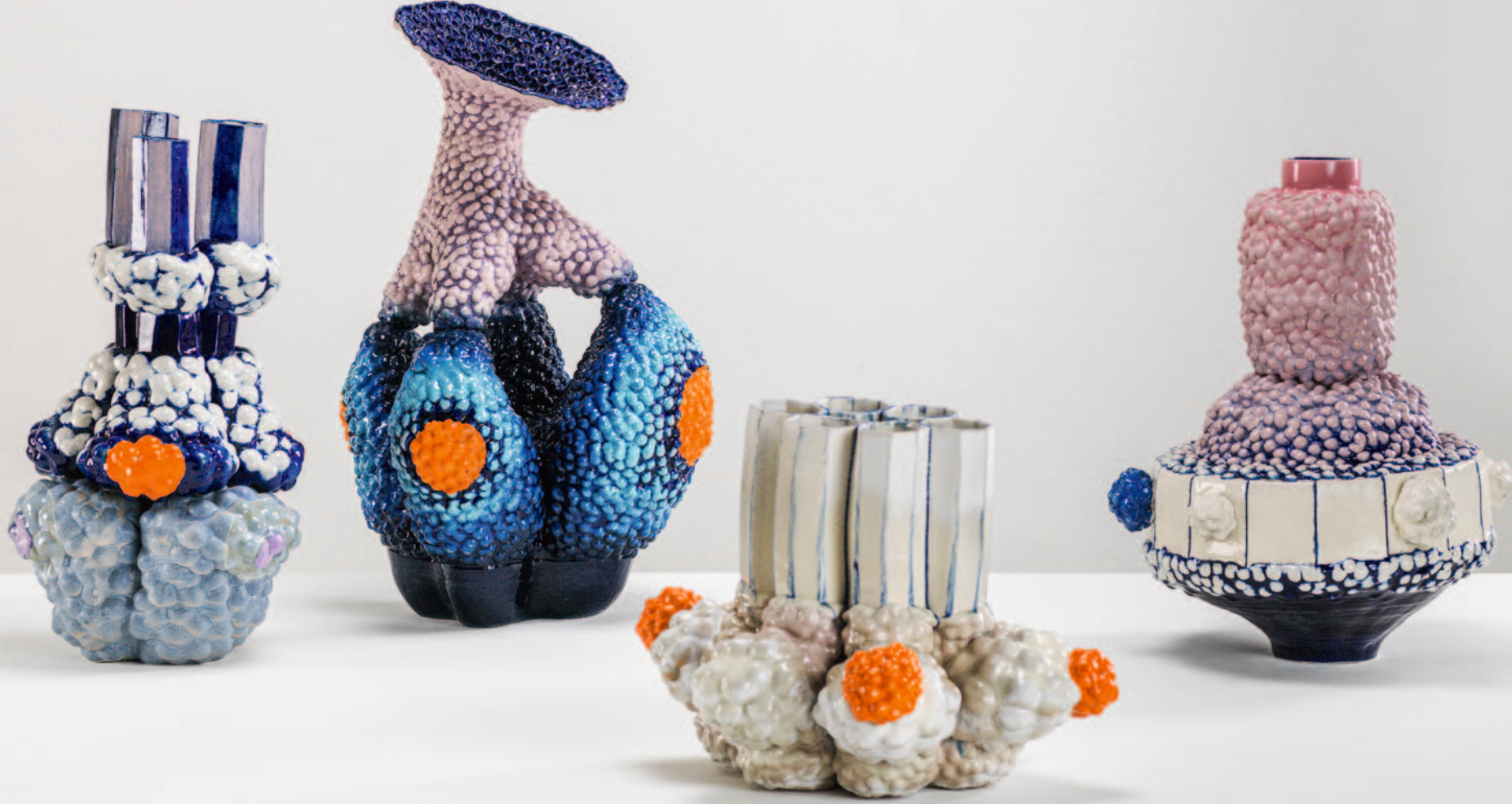
rečhis: O.T. / Keramik / Glasur / 55 x 45 x 45 cm / 2023 2.v.r.: O.T. / Keramik / Glasur / 40 x 45 x 40 cm / 2023