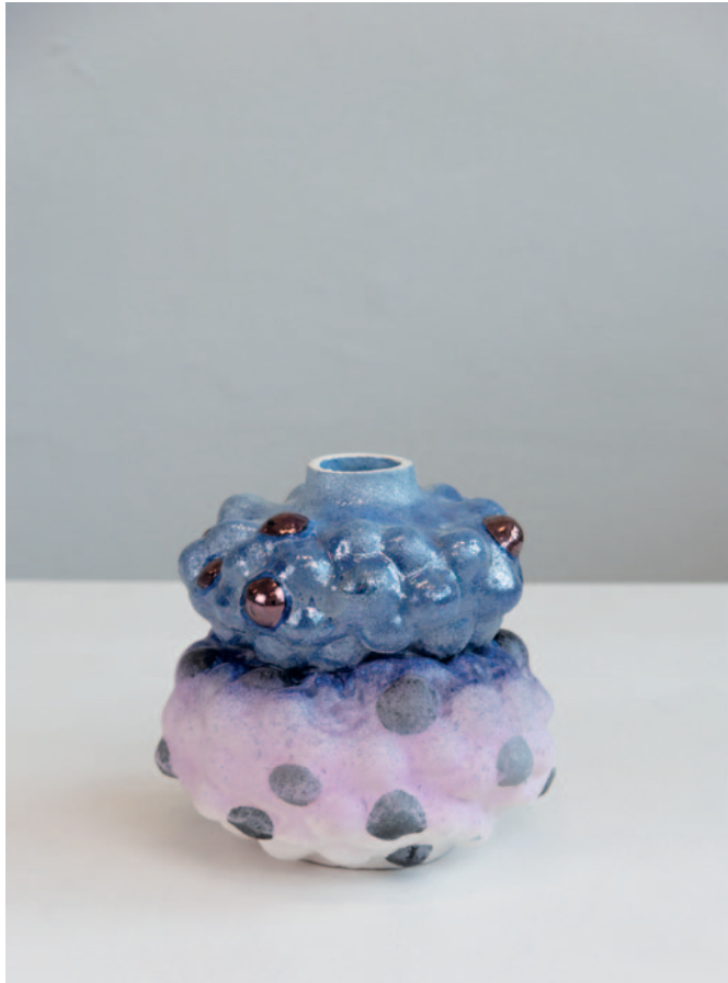
O.T. Keramik / Glasur / Lüster 22 x 21 x 20 cm / 2024