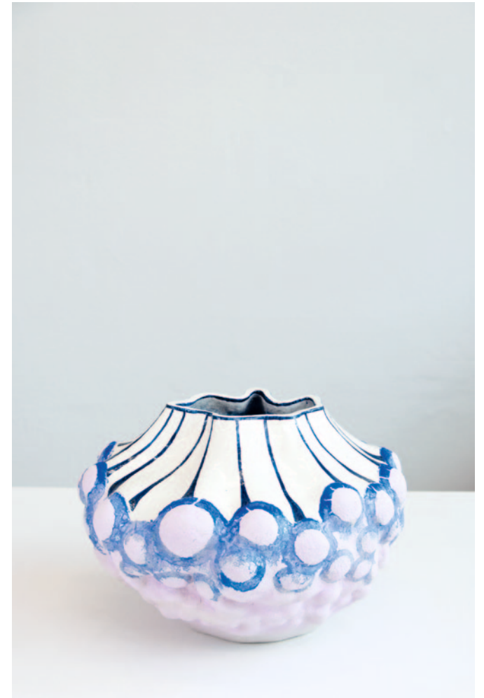
circus Keramik / Glasur 28 x 43 x 42 cm / 2024