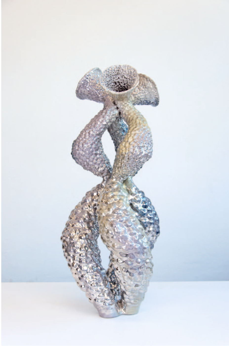
links: O.T. / Keramik / Glasur / Platin / 85 x 50 x 50 cm / 2024 rechts: O.T. / Keramik / Glasur / Luster / 85 x 50 x 50 cm / 2024