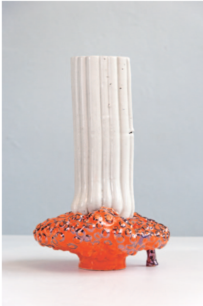
fallen leaves Keramik / Glasur / Lüster 30 x 18 x 16 cm / 2024