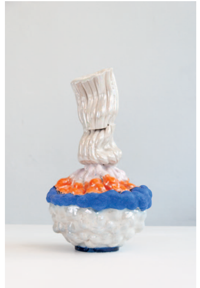
rivers Keramik / Glasur / Lüster 42 x 23 x 22 cm / 2024