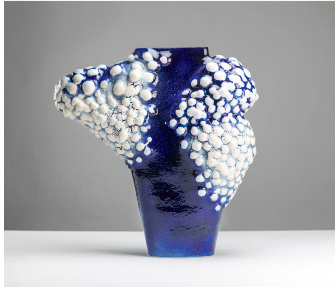
blue bird Keramik / Glasur / 85 x 80 x 40 cm / 2024