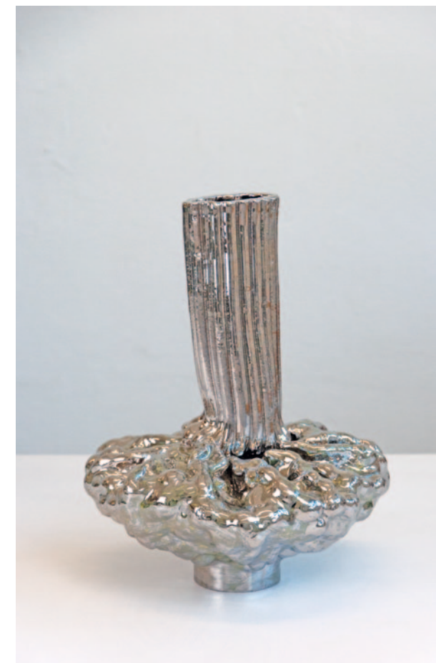
O.T. Keramik / Glasur / Platin 40 x 28 x 30 cm / 2024