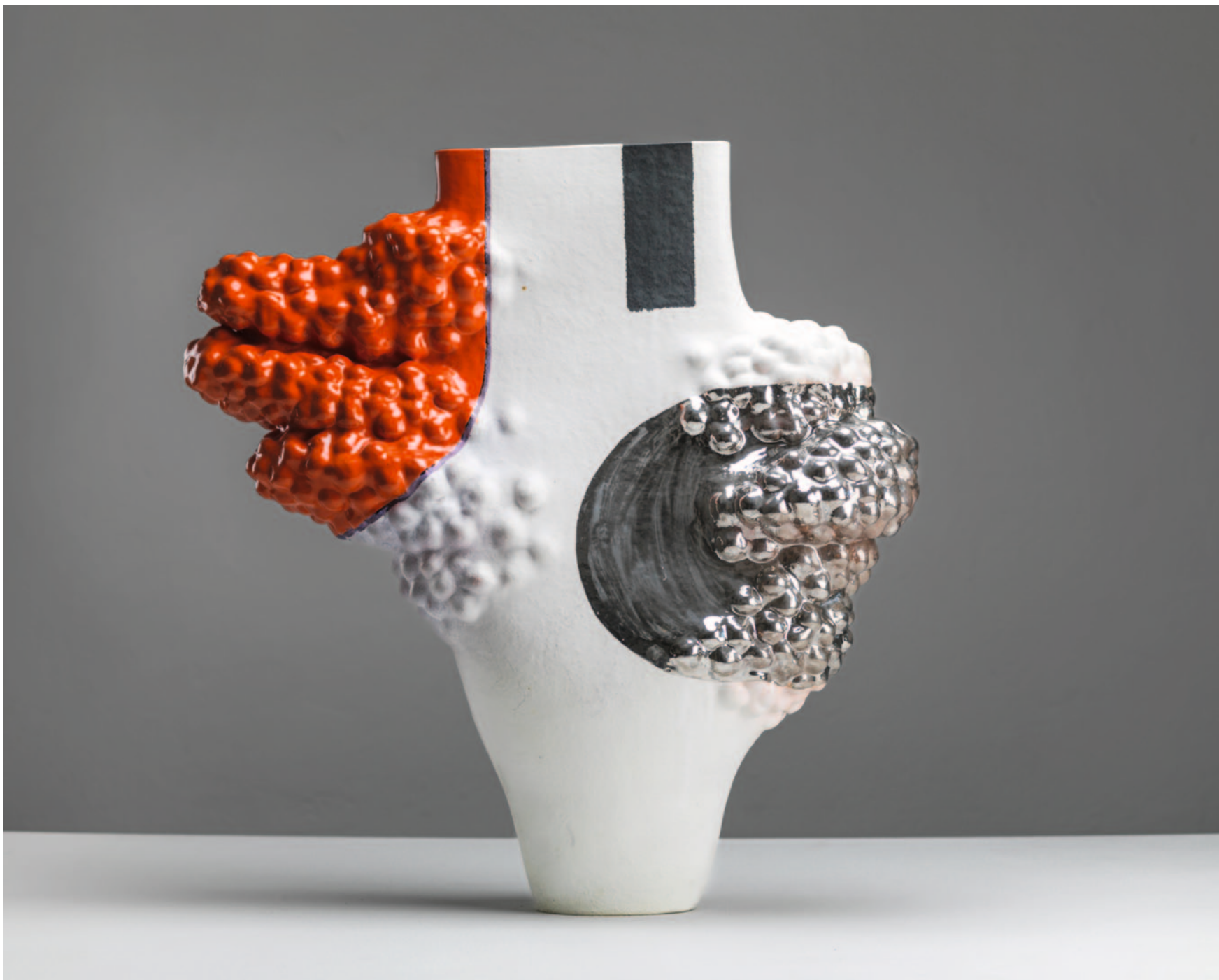
BIRD / Keramik / Glasur / Platin / 90 x 80 x 50 cm / 2024