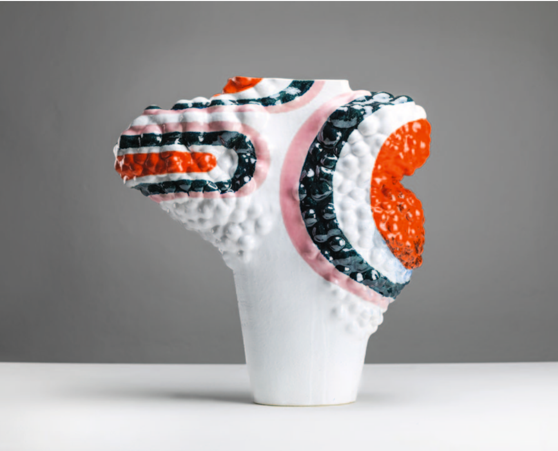
70's suit Keramik / Glasur / 85 x 80 x 40 cm / 2024