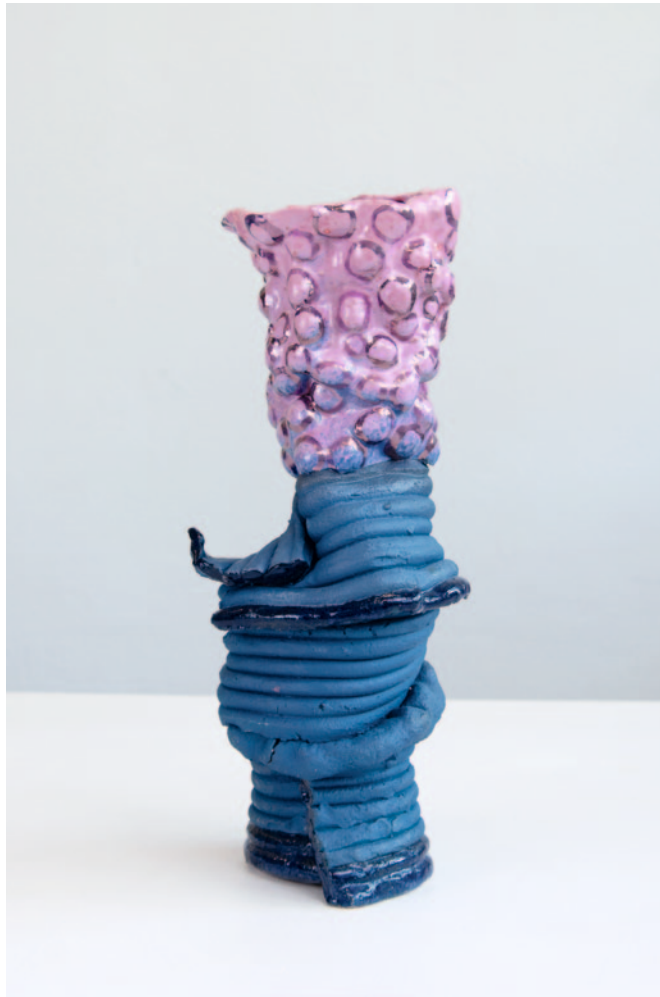
O.T. Keramik / Glasur / Lüster 37 x 17 x 15 cm / 2024