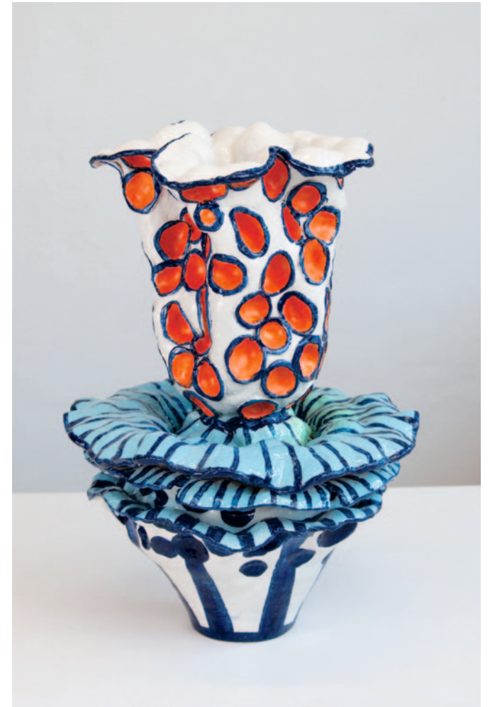
O.T. Keramik / Glasur 60 x 45 x 43 cm / 2024