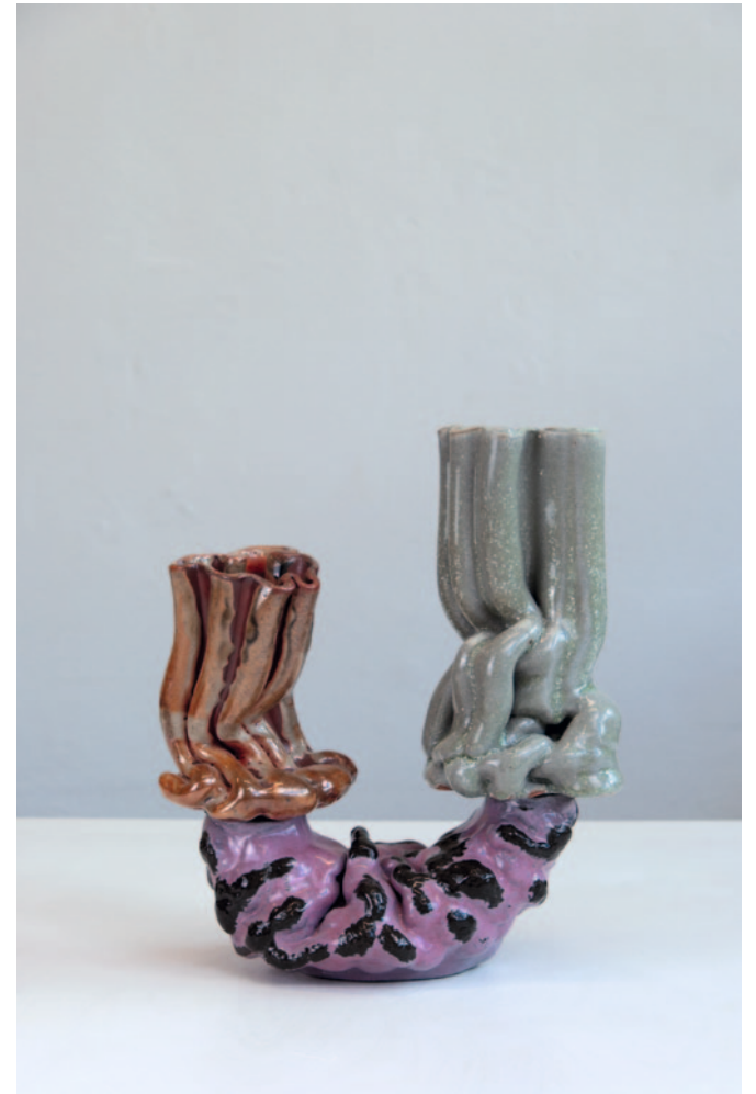
O.T. Keramik / Glasur 35 x 23 x 15 cm / 2024