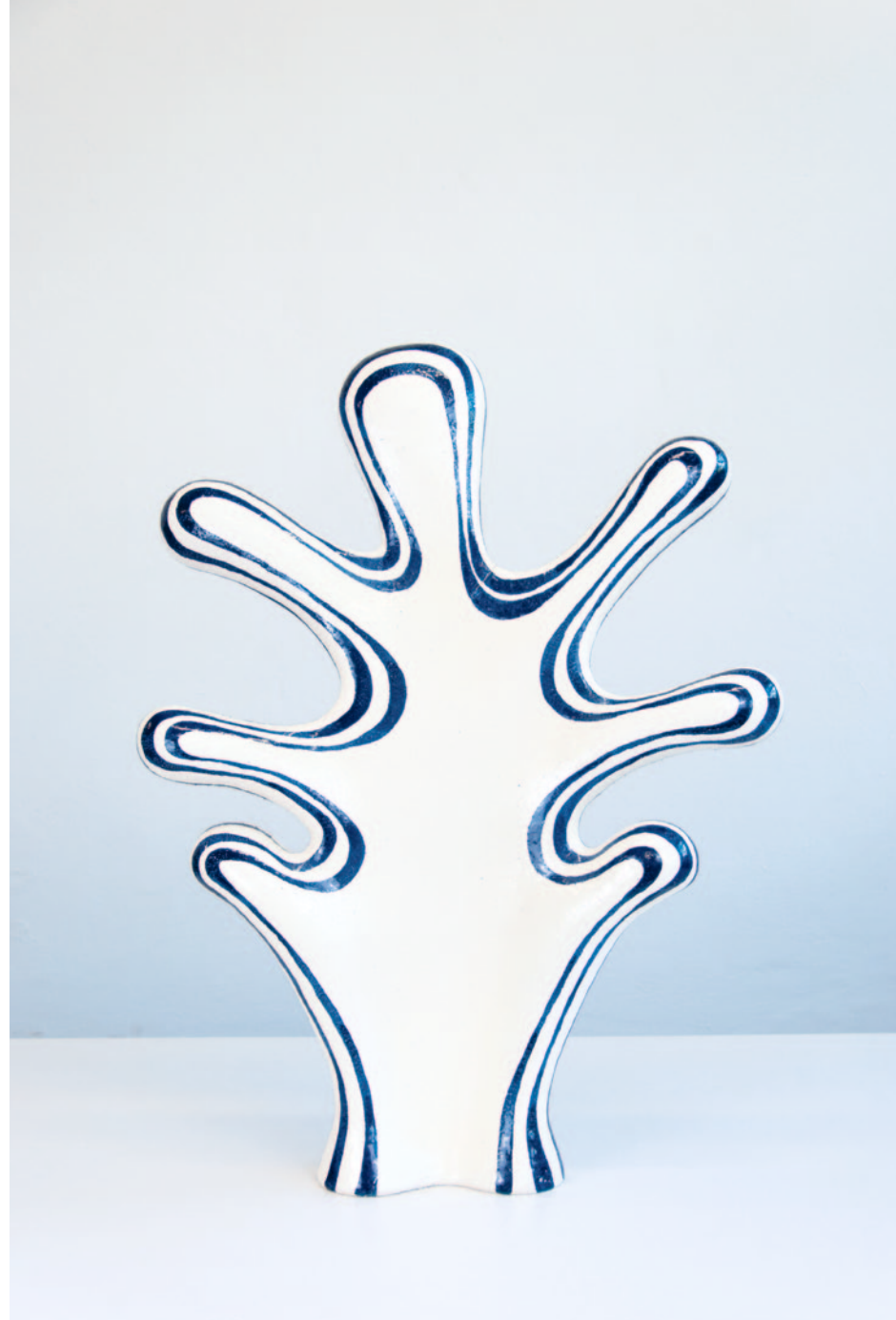
links: Hugs / Keramik / Glasur / 85 x 70 x 19 cm / 2024 rechts: Hugs (Rückansicht)