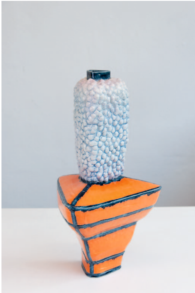
O.T. Keramik / Glasur 50 x 32 x 32 cm / 2024