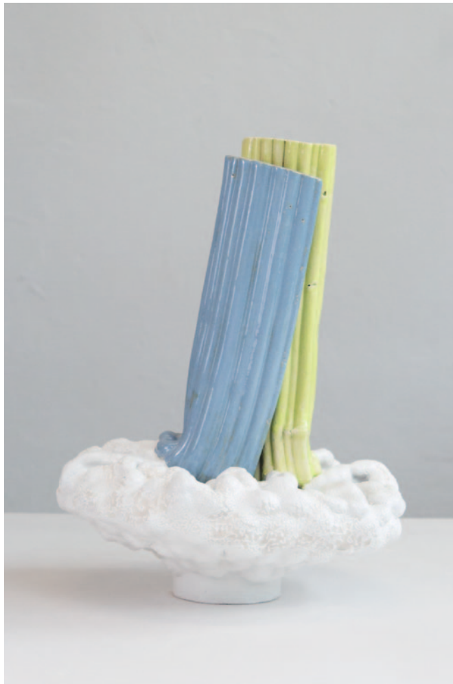
o.T. Keramik / Glasur / 45 x 29 x 30 cm / 2024