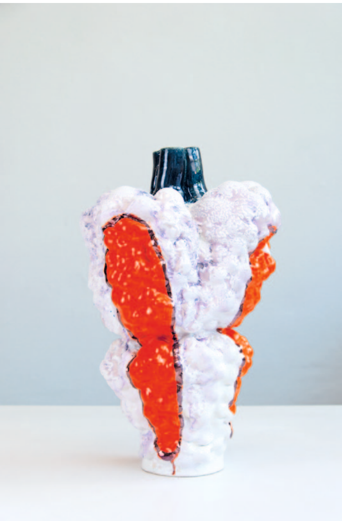
O.T. Keramik / Glasur / Lüster 56 x 32 x 28 cm / 2024