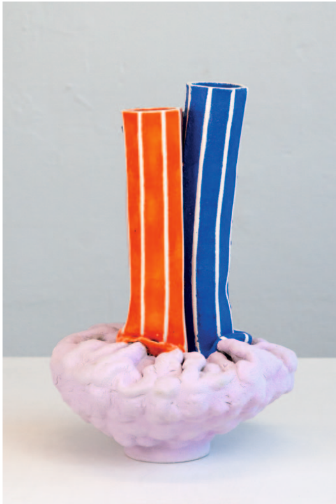
O.T. Keramik / Glasur 45 x 29 x 26 cm / 2024