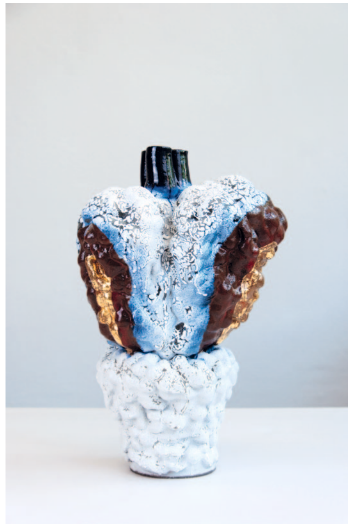
O.T. Keramik / Glasur / Gold 55 x 30 x 27 cm / 2024