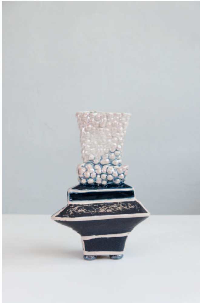
O.T. Keramik / Glasur / Lüster 32 x 20 x 17 cm / 2024