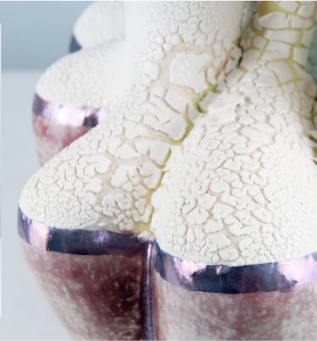
sightseeing Keramik / Glasur / Lüster 45 x 28 x 27 cm / 2024